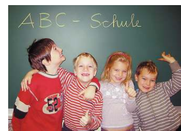
Der nächste Informationsabend findet am 4. März statt.

Engagierte Eltern, kompetente Lehrkräfte, familiäre Atmosphäre – das ist TRINITY in der Gösserstraße in Leoben. Seit rund 5 Jahren wird die innovative ABC-Schulinitiative betrieben, die Kindern von 6 bis 12 Jahren ganzheitliches, individuelles und angstfreies Lernen bietet. Am 4. März findet um 18 Uhr der nächste Informationsabend statt. Auch Schnupperunter-