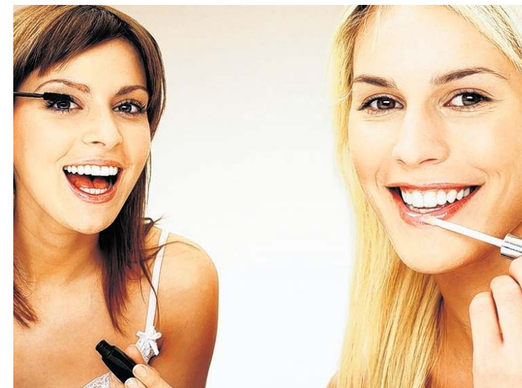
Der Frühling ist die Zeit im Jahr, wo Fitness, Schönheit und Mode eine besondere Rolle spielen, so auch im LCS – Leoben City Shopping.