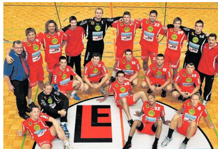
Die Handballer von Union Juri Leoben treffen ihre Fans im LCS.